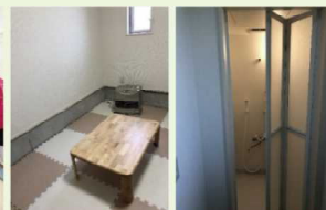
キッズルーム・シャワー室