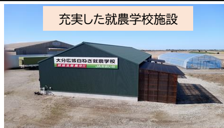
トラクター等の農業用農機を完備