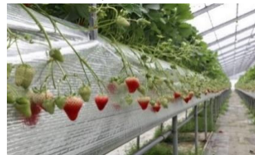
&lt;高設ベンチでのいちご栽培&gt;