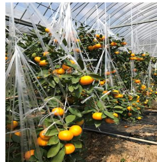
<省エネ対策施設でのハウスミカン栽培>