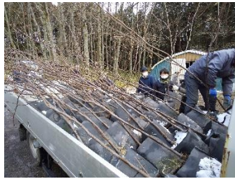
苗の植え付け支援