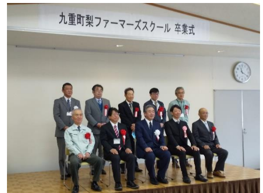
ファーマーズスクール卒業式