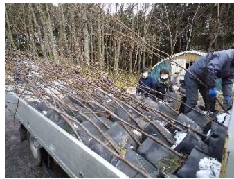
苗の植え付け支援