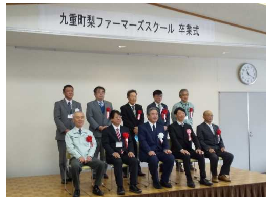
ファーマーズスクール卒業式