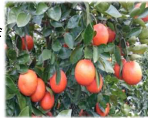
収穫期のサンクイーン

栽培を基礎から学べるシトラススクールの開講（毎月）⇒主催：津久見市農業再生協議会