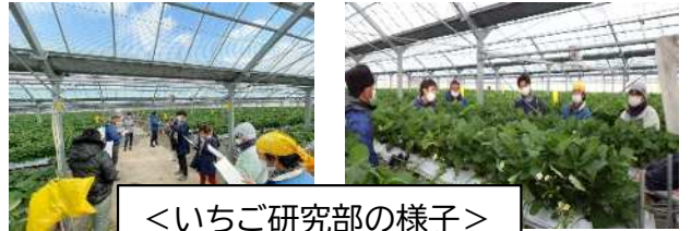
<いちご研究部の様子>