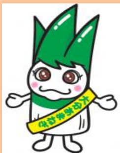
大分あまねぎ「あまねちゃん」®