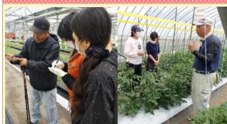
竹田市ファーマーズスクール トマトコース 研修制度

部会員:74名 面積:22ha JGAP取組10名 販売額:7.5億円※R3年度