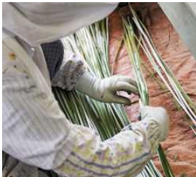
<七島イの選別の様子>

→就農コーチによる実地研修では育苗から収穫、製織まで研修することでき、また座学研修では七島蘭の歴史や特徴を学ぶことができます。