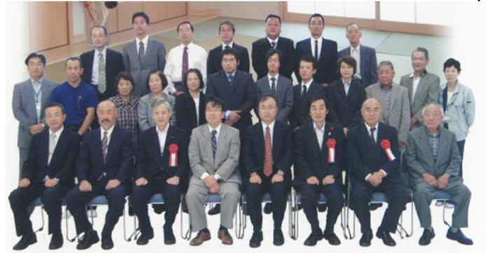
<くにさき七島蘭振興会>