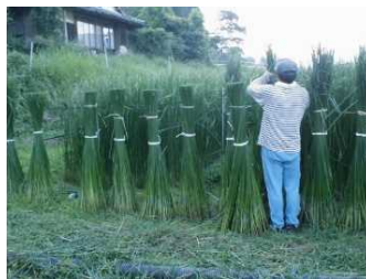
<七島イの刈取の様子>