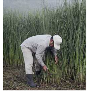
<七島イの刈取の様子>