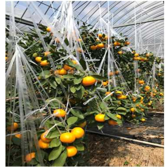
<省エネ対策施設でのハウスミカン栽培>