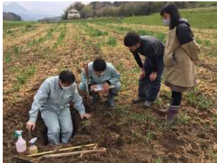
<就農予定地の確認>