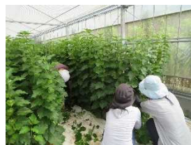
<雇用希望者作業体験>