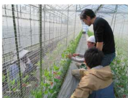
<研修状況巡回確認>