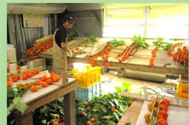
ホオズキ 研修風景

部会の中でも高い技術力をもつ生産者がコーチとなり、コーチのハウスなどで、実際に栽培に携わりながら、栽培技術等を学びます。