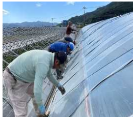
<若手有志による共同ビニール張り>