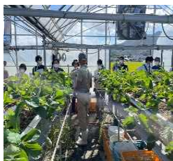
<中部地区栽培講習会>