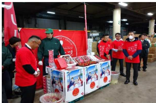
写真：京都市場にてベリーツ販売促進活動