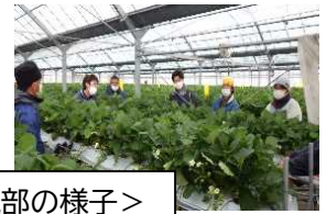
<いちご研究部の様子>