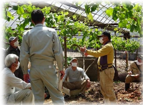
ぶどう部会講習会の様子